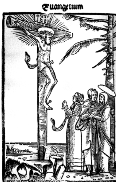
Illusztráció: Sylvester János: Új Testámentom Kőszeg, 1541. (Evangelikus Országos Múzeum)

És végül: mára sem veszítette el létjogosultságát az ételben való önmegtartóztatás, mely a tudatosan vállalt – akár a szó szoros, akár annak átvitt értelmében vett – éhségben a habzsoló és mégis mindig elégedetlen világgal szemben egy mélyebb, tisztább, igazibb élet felé indulunk el. Afelé a világ felé, amely megmutatta magát nekünk Jézus Krisztusban, s évről évre újra felfénylik a Húsvét csodájában.